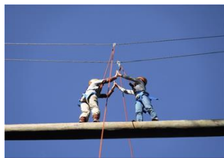
森のチャレンジコース体験