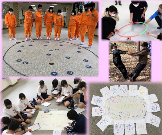
宿泊学習の事前・事後指導