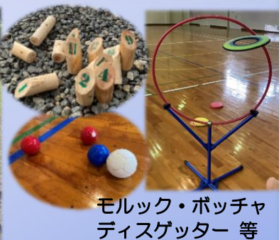
モルック・ポッチャ ディスクゲッター等